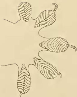
Linker Vorderfuss, von unten. Schwach vergrössert.